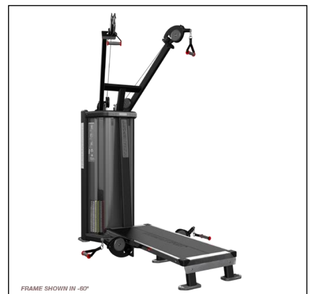
Nautilus HumanSport Pull Lift