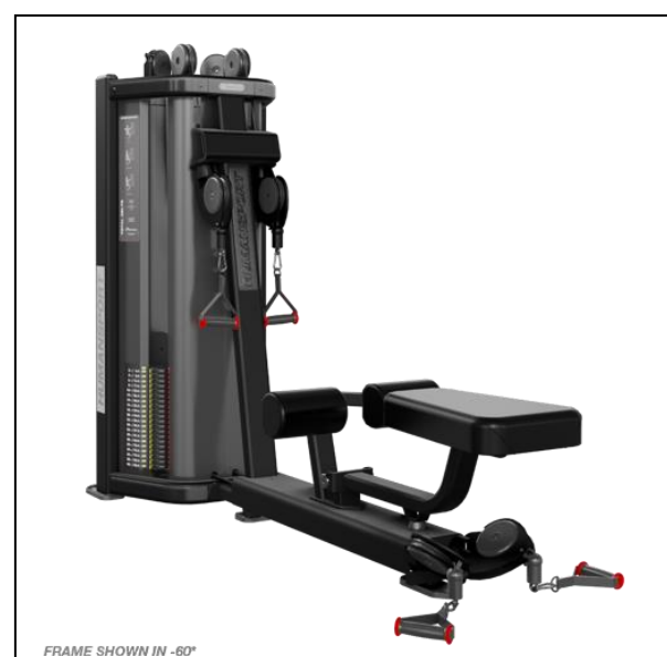
Nautilus HumanSport Total Delts