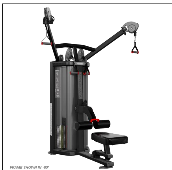
Nautilus HumanSport Lat Pulley