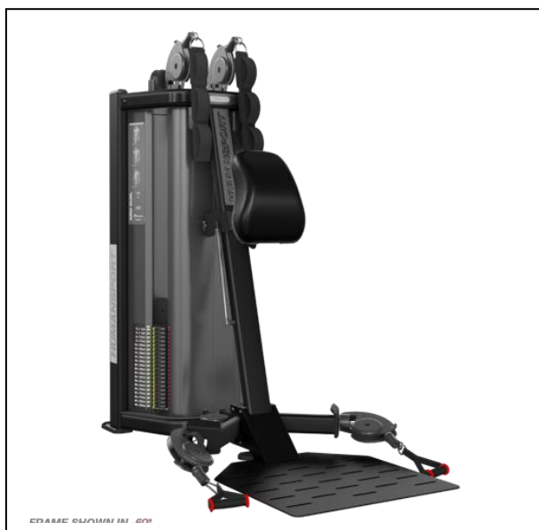
Nautilus HumanSport Arms Chest