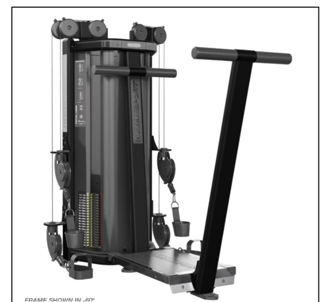
Nautilus HumanSport Total Legs